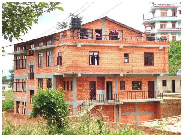
Informelle Schule „Balkumari“ Kathmandu kurz vor der Fertigstellung

Labor für Stuhl- u. Urinuntersuchungen wird eingerichtet.