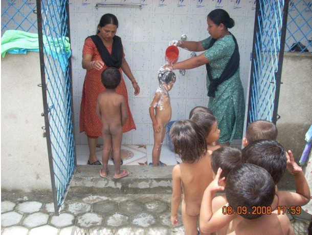
Dusch- und Hygienetag

27 Patenkinder erhalten seit 2008 die Möglichkeit, Schulen mit Abschluss und späterer Berufsausbildung zu besuchen.