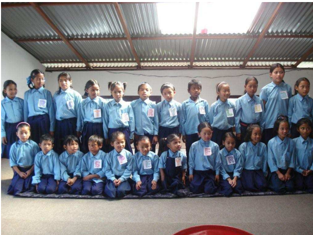
Unsere Patenkinder bilden die Worte: „Rotary Club Speyer“

27 Patenkinder erhalten seit 2008 die Möglichkeit, Schulen mit Abschluss und späterer Berufsausbildung zu besuchen.