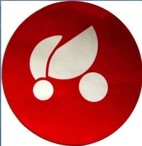
Mütter und Kinder